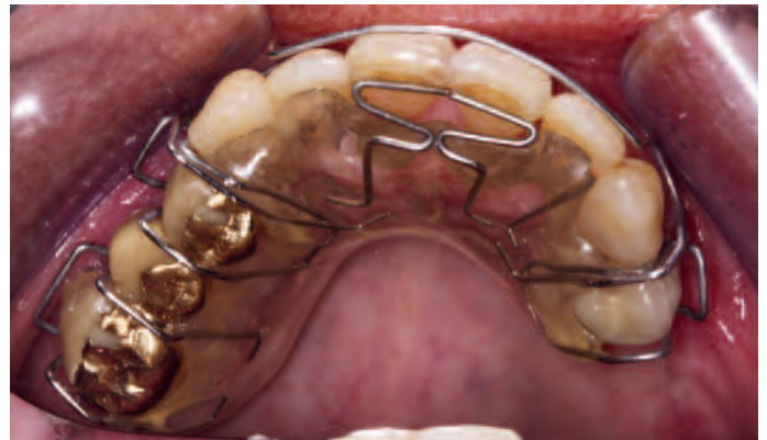
Abb. 13 Schwarz-Platte eingegliedert