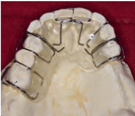
Abb. 12 Nach Wiederbefestigung der alten Brücke im rechten Oberkiefer Anfertigung einer Schwarz-Platte zur weiteren Ausformung der Oberkieferfront