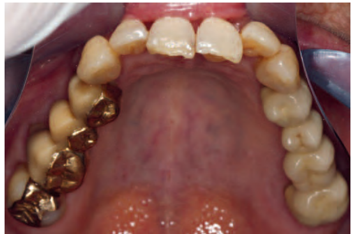
Abb. 20a und b Abschlussbild des rehabilitierten Oberkiefers (links). Auch hier wird im Vergleich zum Ausgangszustand (rechts) die Harmonisierung des Zahnbogens deutlich

Nach erfolgreicher kieferorthopädischer Behandlung wurden die Brackets entfernt (Abb. 17) und die Unterkieferfront mit einem geklebten Retainer versehen (Abb. 18). Nach Osseointegration des Implantates 26 und Exaktion des Zahnes 16 wurde die prothetische Versorgung mittels Zirkoniumdioxidkronen beziehungsweise Brücken durch den über-