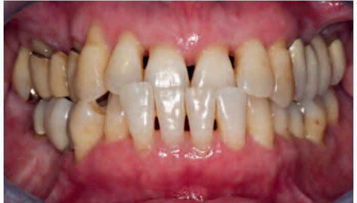
Abb. 19a und b Endergebnis nach Exaktion des Zahnes 16 und abschließender prothetischer Therapie (links). Der Vergleich mit dem Ausgangsbefund (rechts) demonstriert augenfällig die funktionelle und ästhetische Verbesserung (prothetische Versorgung durch Dr. R. Grützner, Kleve)