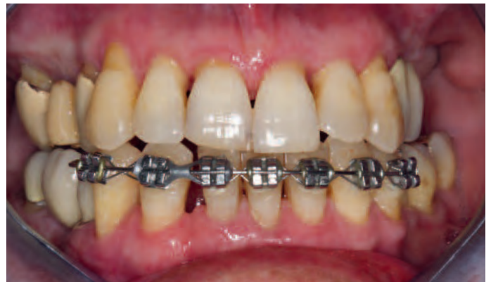
Abb. 15 Das kieferorthopädische Ziel ist fast erreicht