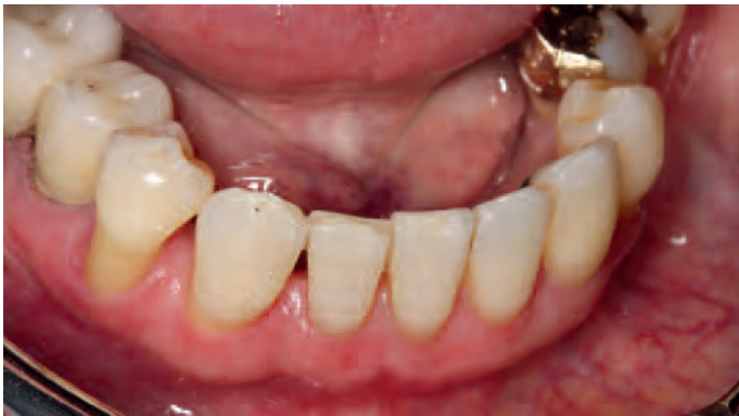
Abb. 17 Zustand nach Lückenschluss und Ausrundung der unteren Front. Auch die Niveaudifferenz zwischen 43 und 44 konnte ausgeglichen werden