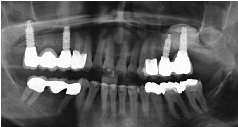
Abb. 21 Orthopantomogramm nach Behandlungs - abschluss