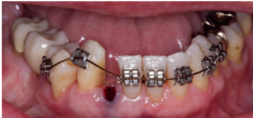
Abb. 7 Anbringen von Brackets an den Zähnen 35 bis 41 und 43 bis 45. Extraktion des im Engstand stehenden Zahnes 42 und einligieren eines Bogens (Twistflex). Durch den Lückenschluss soll der untere Zahnbogen frontal verkleinert werden. Gleichzeitig soll die Niveaudifferenz zwischen 43 und 44 ausgeglichen werden