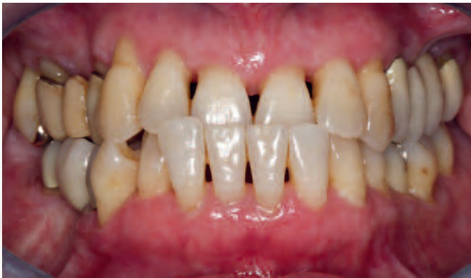
Abb. 2 Ausgangszustand: Anteriorer Kreuzbiss