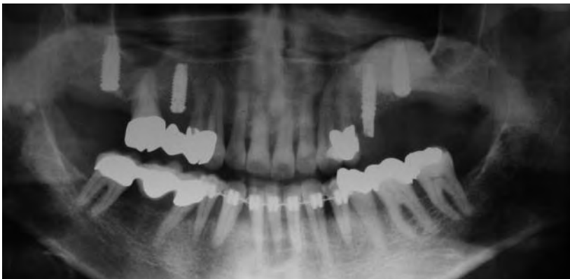
Abb. 16 Insertion eines weiteren Implantates in die augmentierte Region 26

Piezochirurgie eröffnet. Der nach Anhebung der Kieferhöhlenschleimhaut entstandene Defekt wurde mit einem Knochenersatzmaterial aufgefüllt und mit einer resorbierbaren Membran abgedeckt. Danach folgte der speicheldichte Nahtverschluss des zurückverlagerten Schleimhautperiostlappens. Zuletzt wurde die im rechten Oberkiefer zur Implantation abgenommene Brücke provisorisch befestigt und dann die ebenfalls zur Operation entfernte Aufbiss-Schiene eingesetzt. Die gedeckte Einheilung der primärstabil inserierten Implantate verlief komplikationslos. Nach Ablauf der Einheilphase und Freilegung der Implantate erhielt das Implantat 25 aus ästhetischen Gründen keine Einheilkappe, sondern