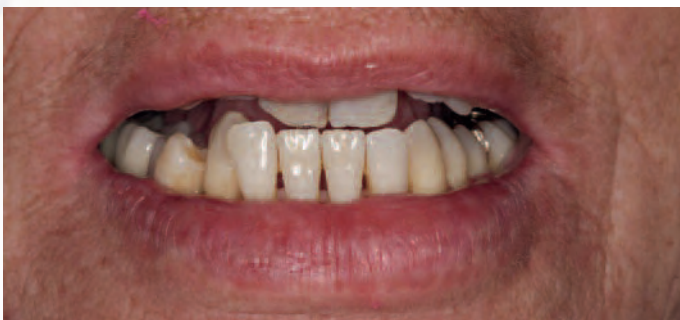
Abb. 4 ... bis fast ein Kopfbiss eingenommen werden kann. Die Bisslage soll temporär über eine Aufbiss-Schiene so weit angehoben werden, dass die im Kreuzbiss stehenden Frontzähne in einen regelrechten Überbiss überstellt werden können