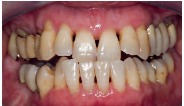
Abb. 3 Ausgangszustand: Bei Mundöffnung kommt es zur Entschlüsselung der prognen Verzahnung ...