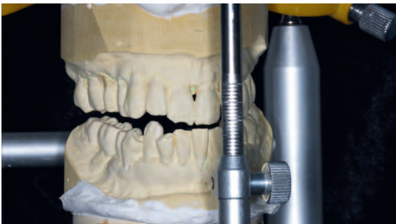
Abb. 6 Schädelbezüglich montierte Modelle zur Herstellung einer Schiene für die temporäre Bisshebung. Die Modelle zeigen auch den deutlich elongierten unteren rechten Eckzahn

Kreuzbiss und ein Engstand regio 42 bis 44, bei introvertierter Stellung der Zähne 11 und 21 (skelettale prognene Tendenz). Zwischen den Zähnen 43 und 44 bestand ein deutlicher Niveauunterschied. Trotz der ungünstigen Verzahnung klagte die Patientin nicht über funktionelle Beschwerden. Das Orthopantomogramm (Abb. 1) bestätigte den schlechten Parodontalzustand der Zähne 17, 16 und 27. Es zeigte aber auch, dass wegen der Ausdehnung der Kieferhöhle regio 26, 27 eine Implantation nur nach vorheriger Augmentation des Kieferknochens möglich sein würde. Die Abbildungen 2 bis 5 zeigen die klinische Ausgangssituation.