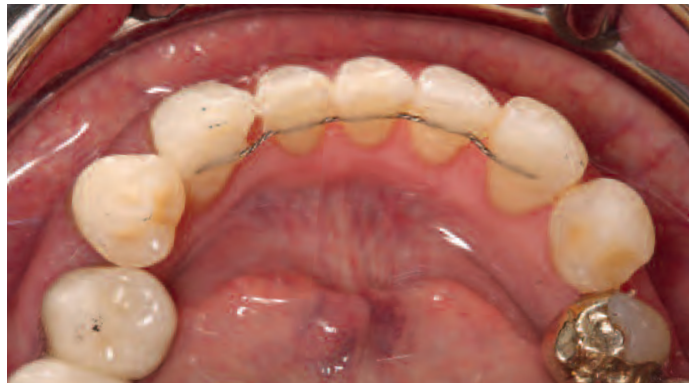
Abb. 18 Stabilisierung der unteren Frontzähne durch einen geklebten Retainer