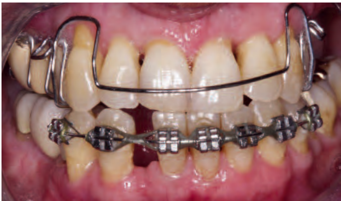
Abb. 14 Zwischenergebnis der präprothetischen kieferorthopädischen Maßnahmen. Im Unterkiefer wurde zwischenzeitlich der Twistflex-Bogen durch einen Rundbogen ersetzt