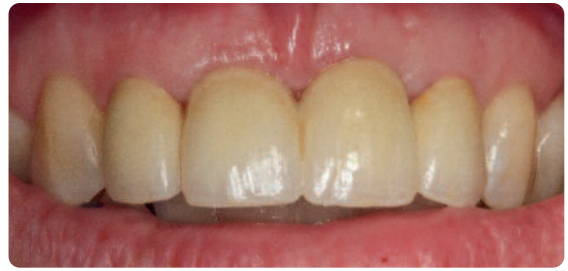
Abb. 9 Die metallkeramische Brücke nach dem Einsetzen