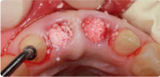
Abb. 3 Nach der provisorischen Präparation der Pfeilerzähne 12 und 22 wurden die Alveolen mit einem Knochenersatzmaterial aufgefüllt