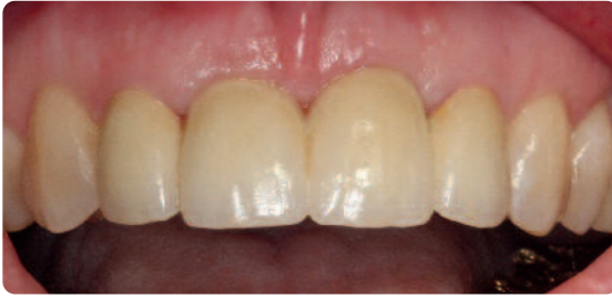
Abb. 10 Nach sechs Monaten zeigte sich eine stabile Weichgewebssituation