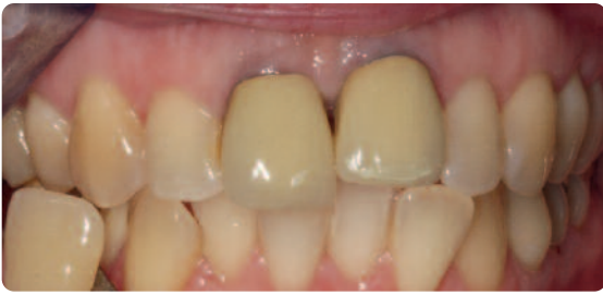
Abb. 1 Die Zähne 21 und 11 waren nicht mehr zu erhalten