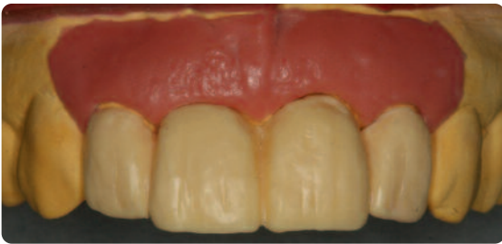
Abb. 5 Das Wax-up mit Gingivamaske