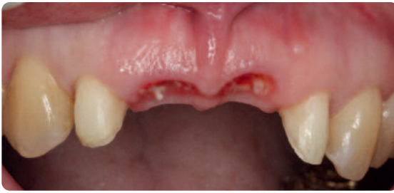
Abb. 8 Die Alveolen sechs Monate nach der Augmentation