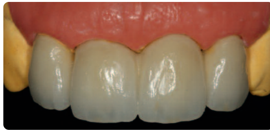
Abb. 6 Die metallkeramische Brücke auf dem Modell