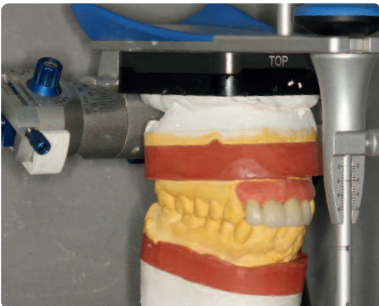
Abb. 7 Herstellung der metallkeramischen Brücke